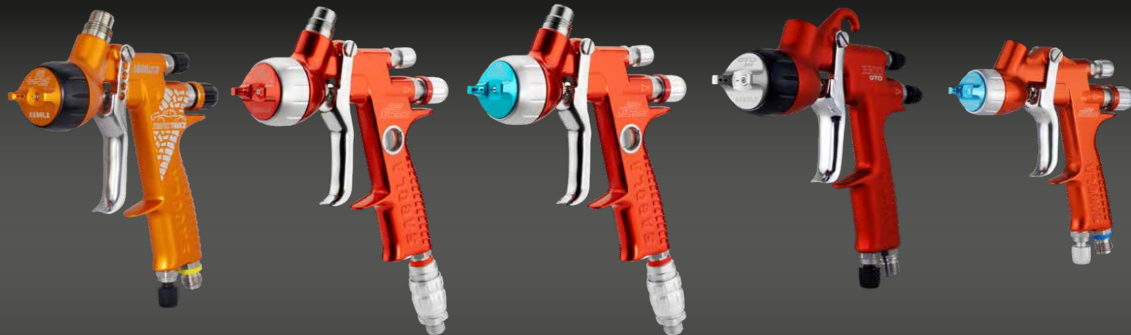
4600 TROPHY TRUCK LIMITED EDITION TITANIA PRO